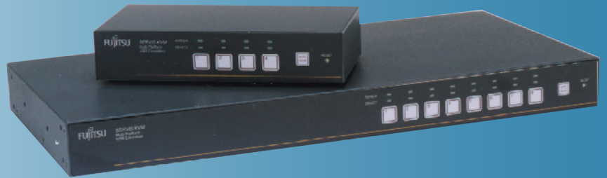
4ポートモデル / 8ポートモデル FS-1004MU / FS-1008MU