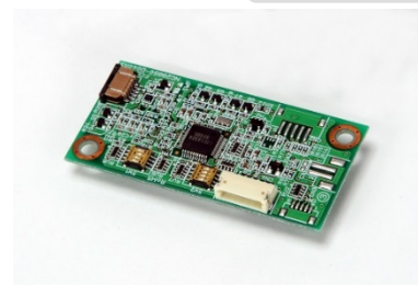
コントロールボード